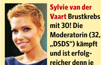
Sylvie van der Vaart Brustkrebs mit 30! Die Moderatorin (32, „DSDS“) kämpft und ist erfolgreicher denn je