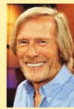
Horst Janson Hohe Schulden zwingen den Star (75, „Bastian“) zu einem sparsamen Leben. Jetzt ist er schuldenfrei